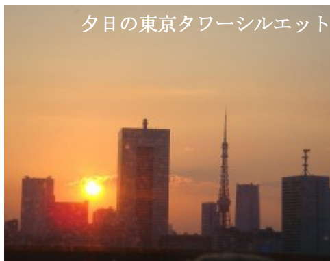
夕日の東京タワーシルエット

5時過ぎにビッグサイトからゆりかもめに乗るとお台場海浜公園を過ぎたあたりから芝浦埠頭にかけて見え隠れする東京タワーが夕日に映えて実に美しい、冬の夕焼けとタワーのオレンジ色を見ていると昭和という時代へフラッシュバックしていくようです。電飾とパラシュートをまとったド派手なジュリーがTOKIOを歌いました。父の時代まで遡るとうだるような夕留のマムシ部屋を思い出します（ひまわり寮という立派な看板はありましたが）寮生から飯炊きのおばちゃんまで紙のように薄くて軽い