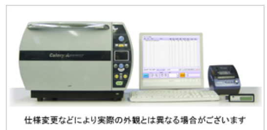
仕様変更などにより実際の外観とは異なる場合がございます

1台目は、東北中心都市の生協様、東北地区担当は本社の私が担当です。弘前から機械を車に積み込みご訪問させて戴きます設置説明と準備されている3品程の食材測定を行って2～3時間頑張ります。2台目は、東海地方鉄道グループのスーパー様へ納品となりました。関東以南は東京営業所の者が訪問して同じ様に設置説明を行います。『カロリーアンサー』は日本中で活躍していて来月は5台納品予約を頂いていまして、今月完成へ向けて着々と進んでおります。9月の完成分はご予約載っている分で完売となってしまいました。お急ぎの方は11月納品分の予約受付を開始していますと言っても、iPhone5の様に長蛇の列とはなりません。『消費者庁の食品表示一元化検討委員会報告書の公表』を受けて法案提出が近い事からお問合せが急増しております。ご検討されている企業様はお早めにご連絡の程宜しくお願いたします。